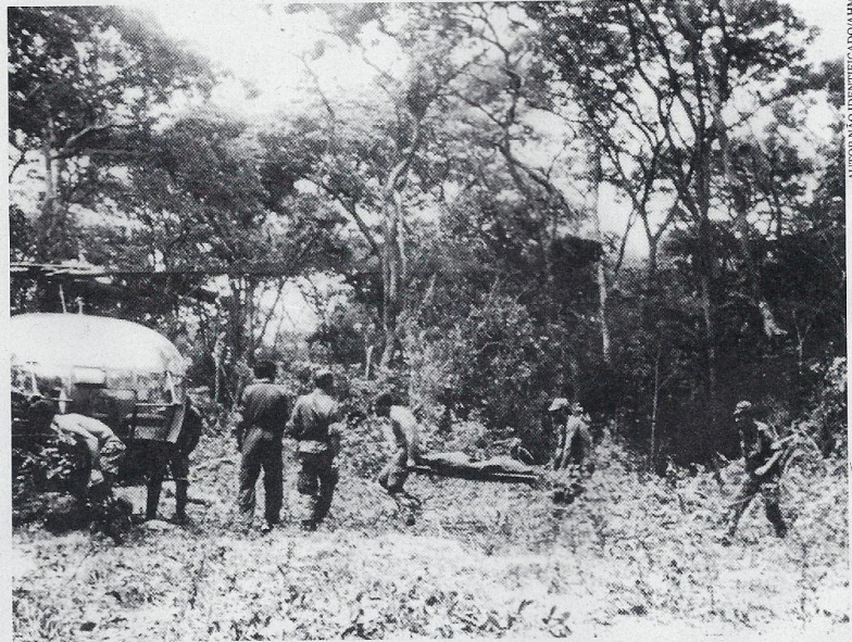
Angola, evacuação de um ferido, em data posterior a 1965. Muitos militares evitaram, na época, o estigma de deficiente

O pressuposto inicial de que a "quase totalidade dos queixosos seriam pessoas afectadas por doenças emocionais com emergência tardia" não se confirmou e os queixosos tardios "apresentaram muitos outros traumas que não são do foro emocional", contrariamente