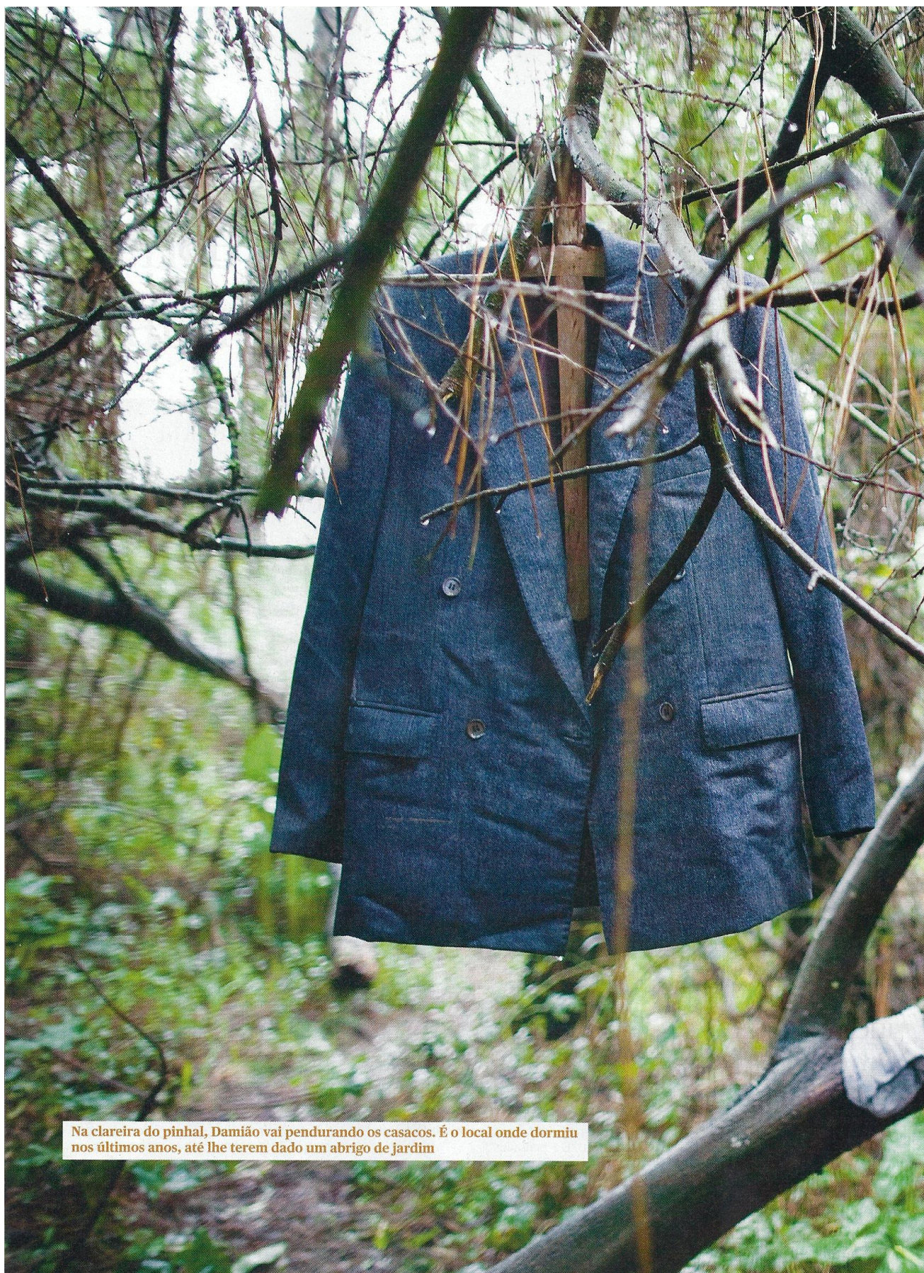
Na clareira do pinhal, Damião vai pendurando os casacos. É o local onde dormiu nos últimos anos, até lhe terem dado um abrigo de jardim