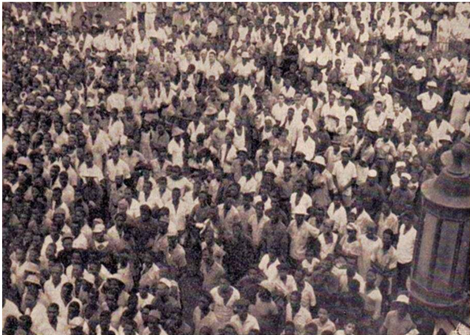
Outro aspecto da manifestação

Todos os oradores foram muito ovacionados e interrompidos com muitos vivas a Portugal.