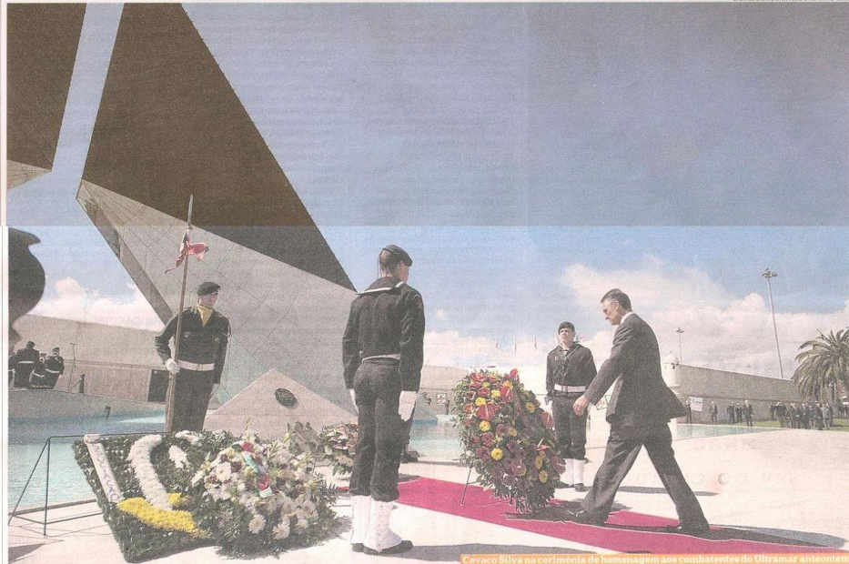
Cavaco Silva na cerimónia de homenagem aos combatentes do Ultramar em Évora