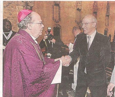
Bispo castrense e ministro da Defesa, após missa nos Jerónimos