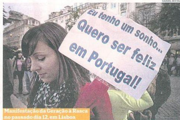
Manifestação da Geração à Rasca no passado dia 12, em Lisboa