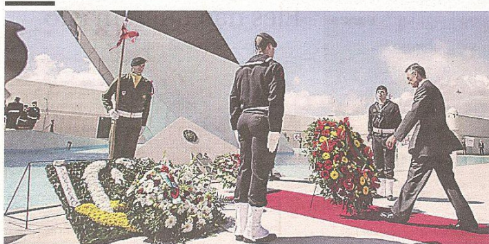
Presidente da República deposita coroa de flores no Monumento aos Combatentes do Ultramar