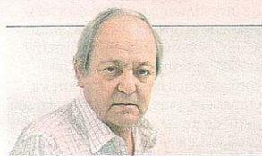
Vasco Pulido Valente