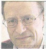
Francisco Louçã acusa Cavaco Silva de comparar “as Forças Armadas de hoje com as da ditadura e do colonialismo”.

O deputado bloquista argumentou que “os jovens de hoje não têm nenhum exemplo a recuperar do ‘empenho’ de quem foi para uma guerra, suicidariamente mantida por uma ditadura, sem poder dizer uma palavra sobre o assunto”. E continuou: “Os militares que o puderam fazer, aliás, pegaram em armas para devolver a democracia e poder de decisão aos portugueses, um acto libertador que levou a liberdade a quem se batia pela sua autodeterminação noutra conti-