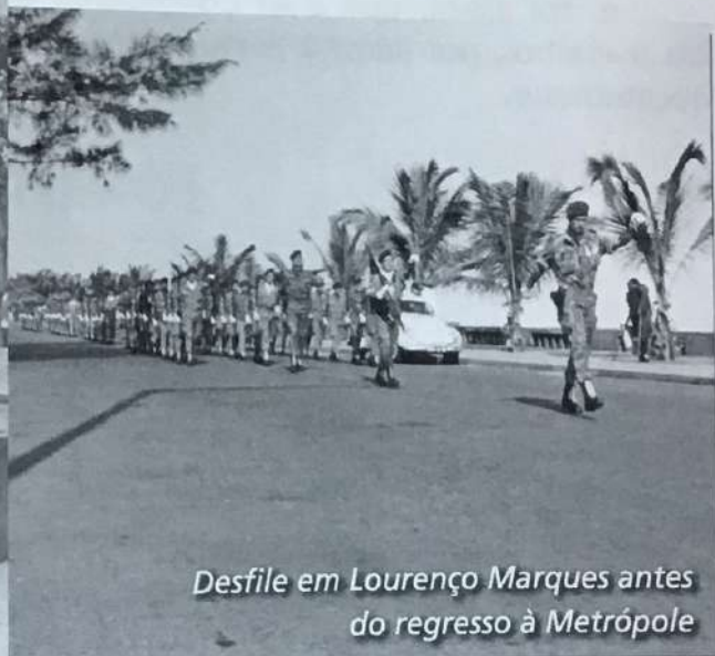
Desfile em Lourenço Marques antes do regresso à Metrópole

Procurando transmitir a melhor imagem deste acontecimento, apresenta-se um extracto de um dos jornais locais datado desse dia: