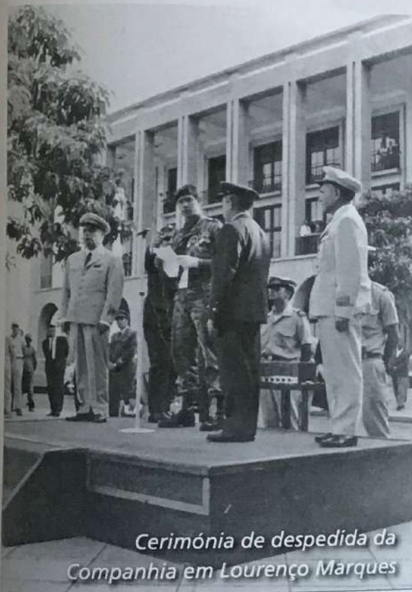
Cerimónia de despedida da Companhia em Lourenço Marques

Equipados e armados todos os militares, a 4ª CCP desfilou nas principais avenidas da capital perante enorme multidão, com o orgulho e a consciência do dever cumprido, após o que regressou ao navio e continuou a sua viagem tendo chegado a Tancos em 04 de Setembro de 1968 (O.S. 209/68 do RCP).