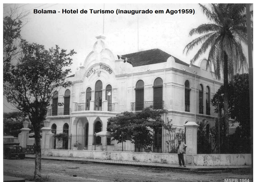
Bolama - Hotel de Turismo (inaugurado em Ago1959)