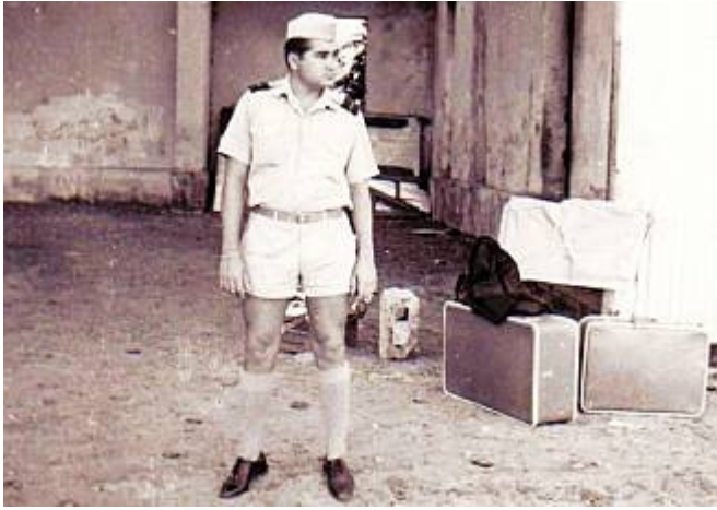
&lt; Bolama &gt;