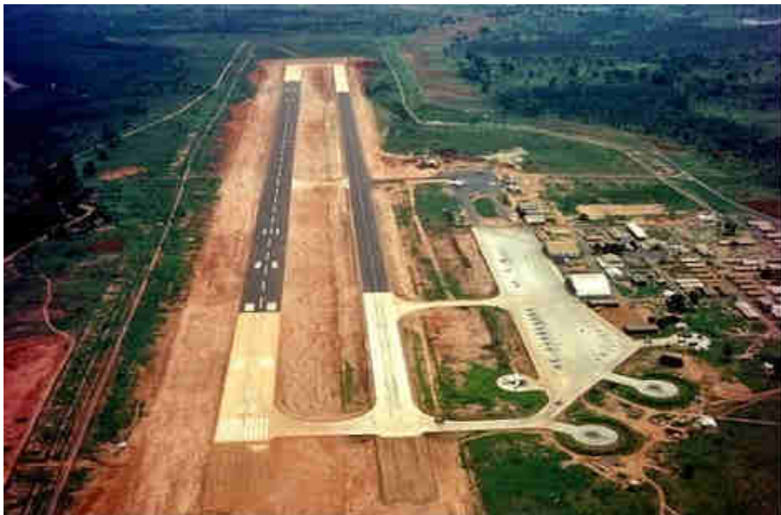
1966 - Base Aérea nº12, com a nova pista.

Dentre esses flashes que persistem, seleccionei um para construir este meu testemunho.