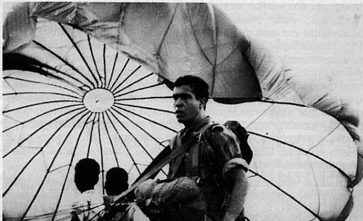
APÓS UM SALTO, EM LUANDA