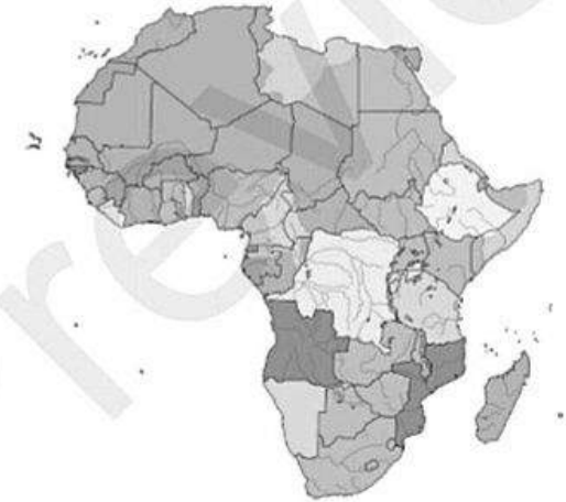
África em 1914

Ofendidos que nós ficámos, até fizemos um Hino... "Contra os Bretões, Marchar, Marchar..."