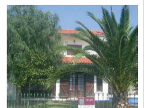
Moradia Isolada T3 Febres

Temos também para venda, em todo o país APARTAMENTOS · MORADIAS · QUINTAS · SOLARES · HERDADES LOJAS · LOTES DE TERRENO (para empresas e para particulares)