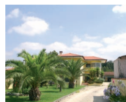
Moradia Isolada T5 Vilamar