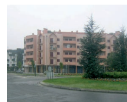
Andar T3 Bom Estado Cantanhede