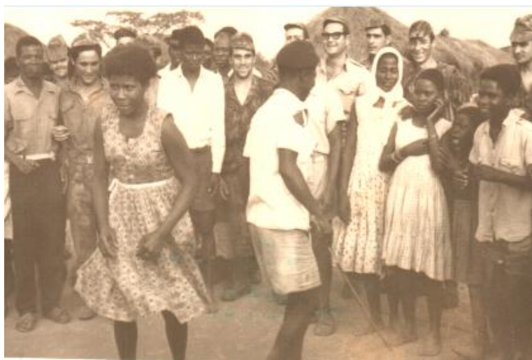
Dançando para os “tropa” em Vista Alegre