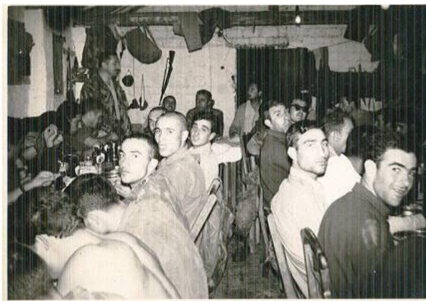
Consoada no Natal de 1962