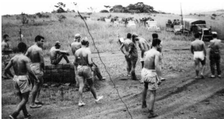
A chegada dos substitutos

Finda a refeição, o pessoal arrumou-se conforme pode. Por não haver camas disponíveis para todos, os nossos novos companheiros foram distribuídos pelas casernas, ficando uns no chão e os outros por onde se puderam desenrascar.