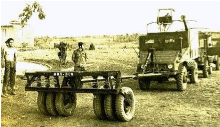
O rebenta-minas da CCE 306, em Pangala

Aquela geringonça foi aprovada e mandada executar. O resto não era com eles. Os que andavam na mata que se desenrascassem.