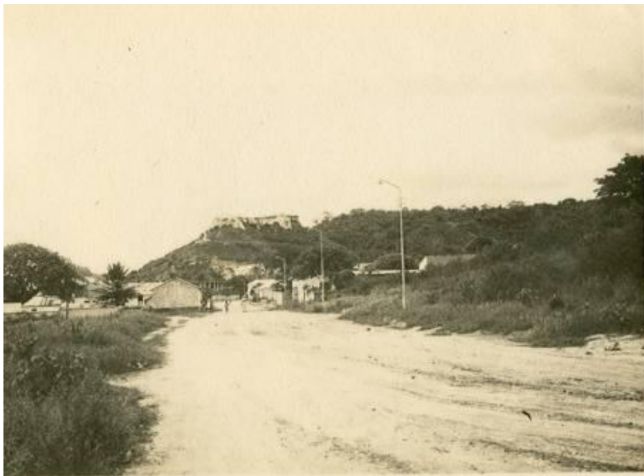
Ao fundo a Fortaleza da Muxima