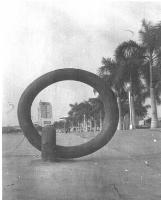
Avenida Marginal - Luanda/1963

Também nesta guerra parece suceder a mesma coisa, pelo que ouvi há momentos. Os que morreram serviram simplesmente de caução aos que ficaram vivos: os “Heróis”?!