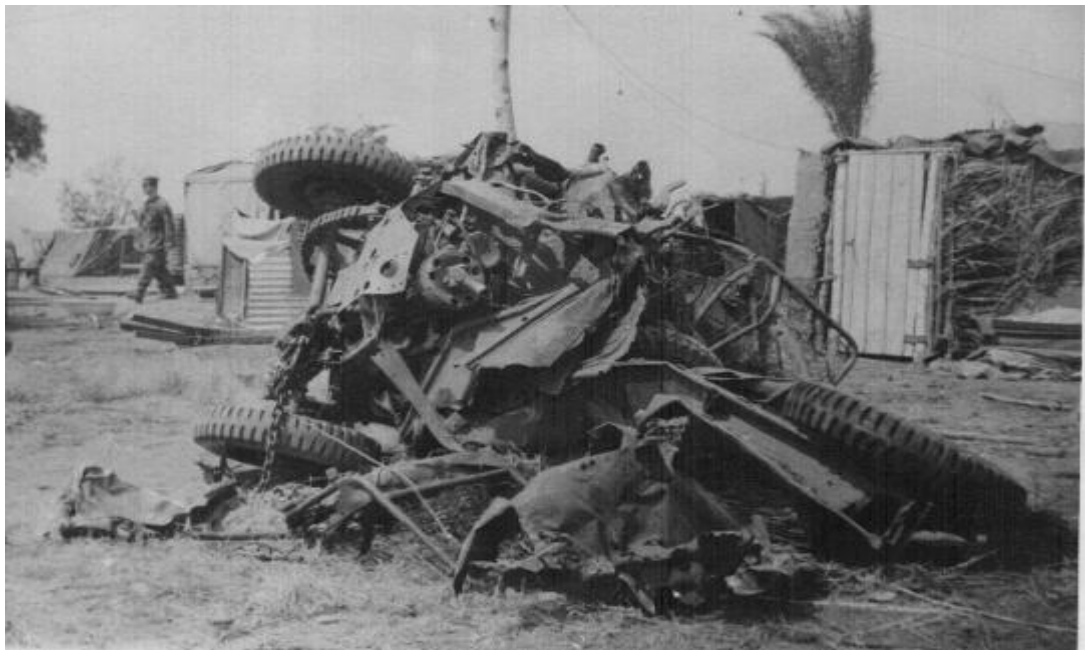
O Jipe minado

Tínhamos que esquecer o que se passou. Não podíamos mostrar ao IN o nosso medo.