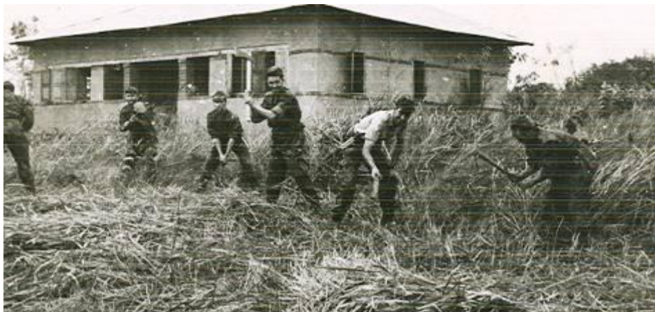
Casa de Pangala

as quais fazíamos sandes. Mas para fazer sandes era preciso pão e para o cozinhar era preciso água...!