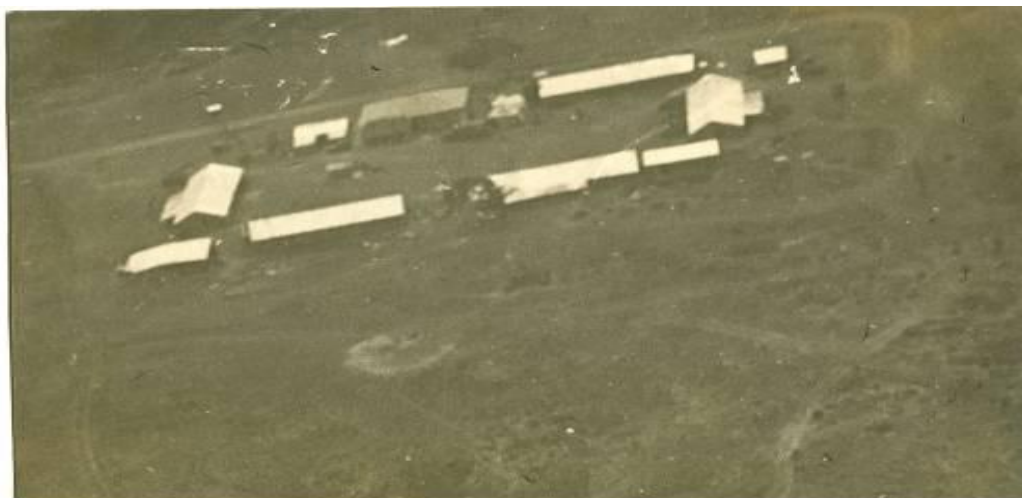
Vista aérea do acampamento da Companhia 306

A chegada ao acampamento era um descanso para quem vinha da “rua”. E para quem estava! Só nessa altura conseguíamos descontraír. O espírito de equipa quer a nível de pelotão quer a nível de Companhia era tal que quando um indivíduo era ferido parece que todos sentiam essa dor.