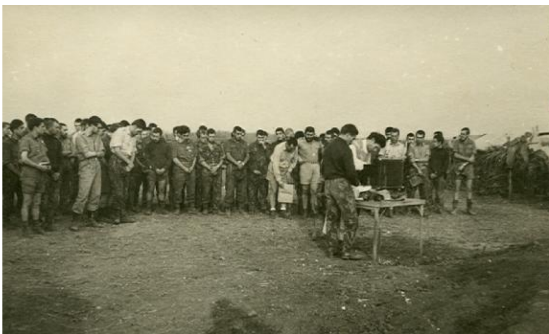
A primeira missa em Pangala

Chegou a semana seguinte e com ela o padre Capelão do nosso Batalhão. Vinha com ar satisfeito, fato de combate a estrear, enfim, parecia um “maçarico” - qualquer elemento que chegasse de novo à Unidade, para ficar, era apelidado de “maçarico”.