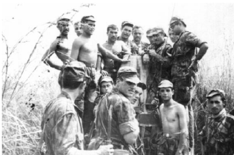
No marco geodésico

Tive a curiosidade de analisar uma dessas plantas. Se lhes tocássemos com o cano da arma, não reagiam. Mas bastava aproximar um dedo e logo as gavinhas tentavam enrolar-se-lhe. Plantas carnívoras?! Nunca cheguei a saber.