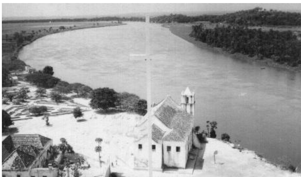
O Rio Quanza visto da Fortaleza da Muxima

Eu estava com o enfermeiro civil no cais de embarque, quando vejo uma cena algo estranha! Rio abaixo vinha uma ilhota com um coqueiro e uma cubata! Chamei a atenção do enfermeiro que me informou ser natural. Os pretos gostam de ter as suas habitações junto à água e de vez em quando, e quando a chuva é muita, sofrem destes dissabores.