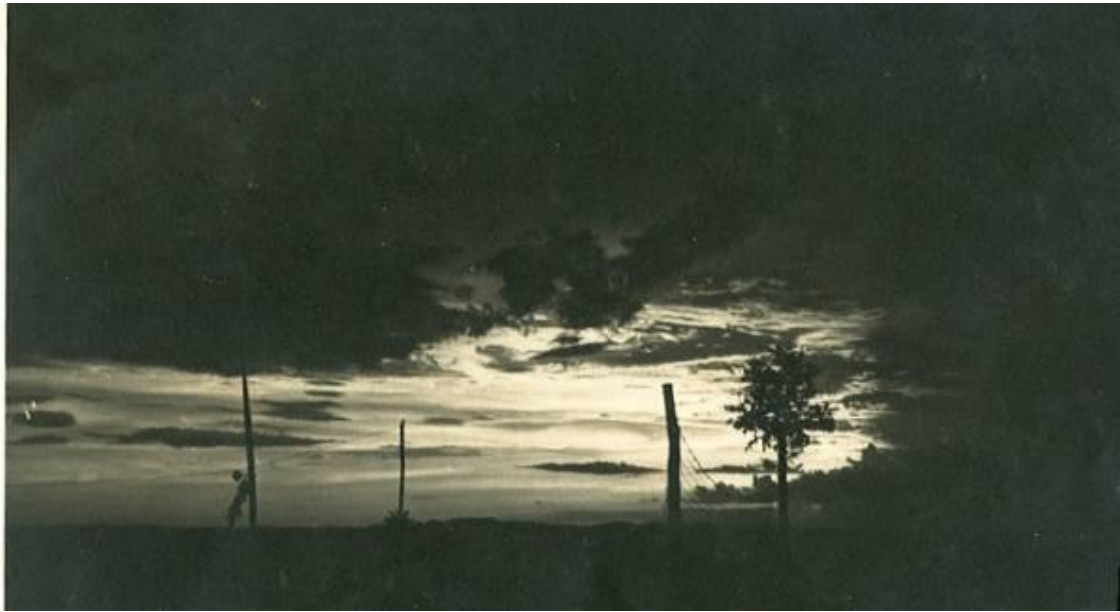
Pôr-do-sol em Pangala, com prelúdio de trovoada