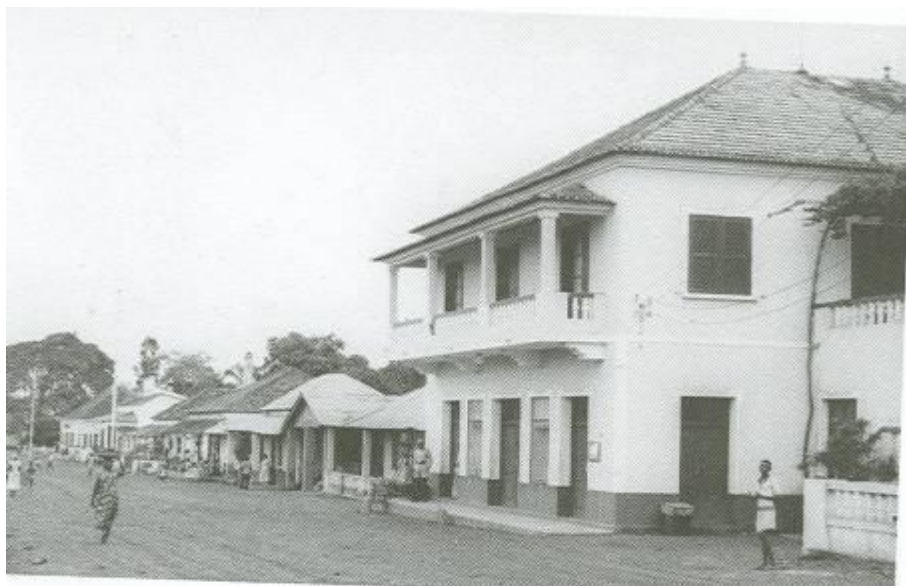
À direita na foto o “Comércio” onde o autor comprava os artigos para fotografia (A casa Salvador Beltrão)

Regressámos com as GMC a abarrotar de comida, cerveja e 7Up, bebidas refrescantes. A cantina já havia sido montada na casa do Comando. Lá estava o tão desejado frigorífico, sempre cheio de bebidas frescas! Como só havia electricidade parte da noite, o frigorífico era alimentado a petróleo.