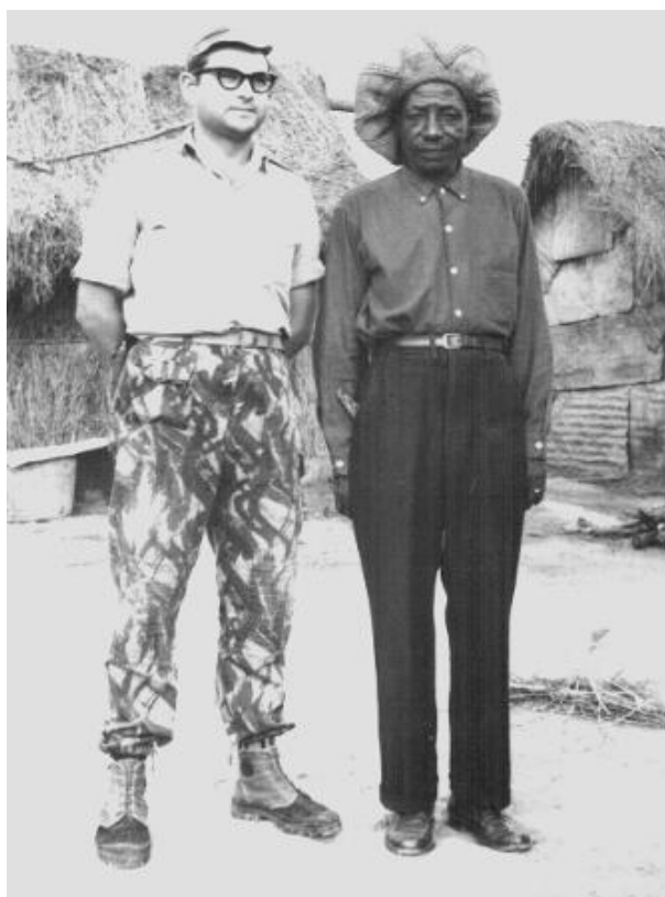
Com o Soba de Vista Alegre

A seguir a esta festa fui dar uma volta pela sanzala, entretive-me a conversar com o Soba, a quem pedi para tirar uma fotografia a seu lado, coisa a que prontamente acedeu, ajeitando o chapéu de palha – uma verdadeira obra de arte – e tomando uma posição de pose. Feita a fotografia, agradeçi-lhe e continuei a passear pela sanzala.