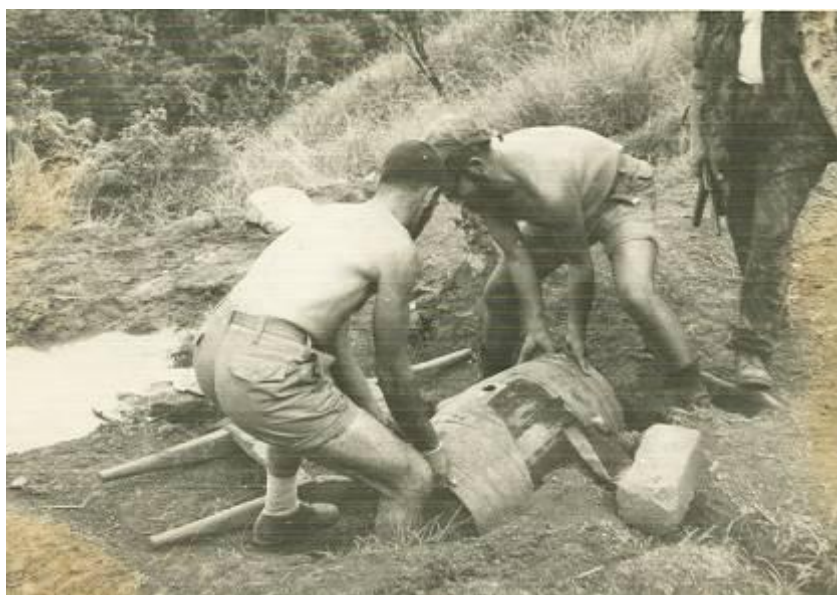
Abastecimento de Água

No dia seguinte, ao fim da tarde, a padiola estava pronta a ser utilizada.