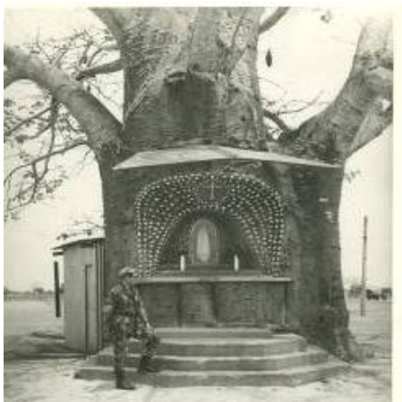
Capela do Grafanil, cavada no tronco de um embondeiro

Bom, bom, era ficar numa repartição com “ar condicionado”, em Luanda. Mas eu tinha sido treinado para outro fim. Não era filho de nenhum General! Tinha sido treinado para passar sede, fome se fosse necessário e, pior ainda, para quando tivesse de enfrentar o IN ter a certeza de que não haveria alternativa: ou ele ou eu! Foi esta certeza que incutimos também nos nossos comandados. Num momento daqueles não pode haver hesitações, porque podemos não ficar cá para contar como foi.