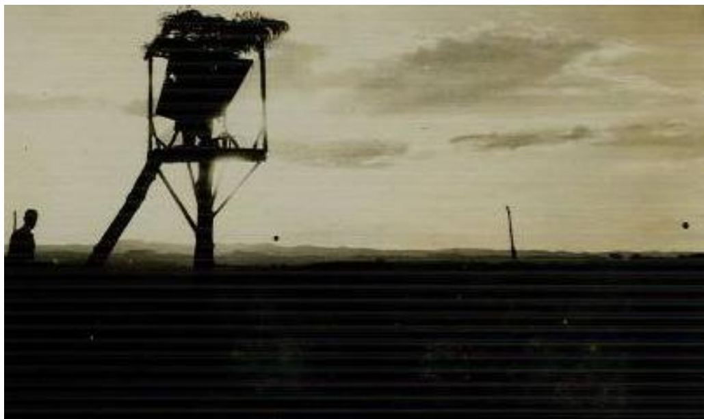
Posto de observação... e de meditação