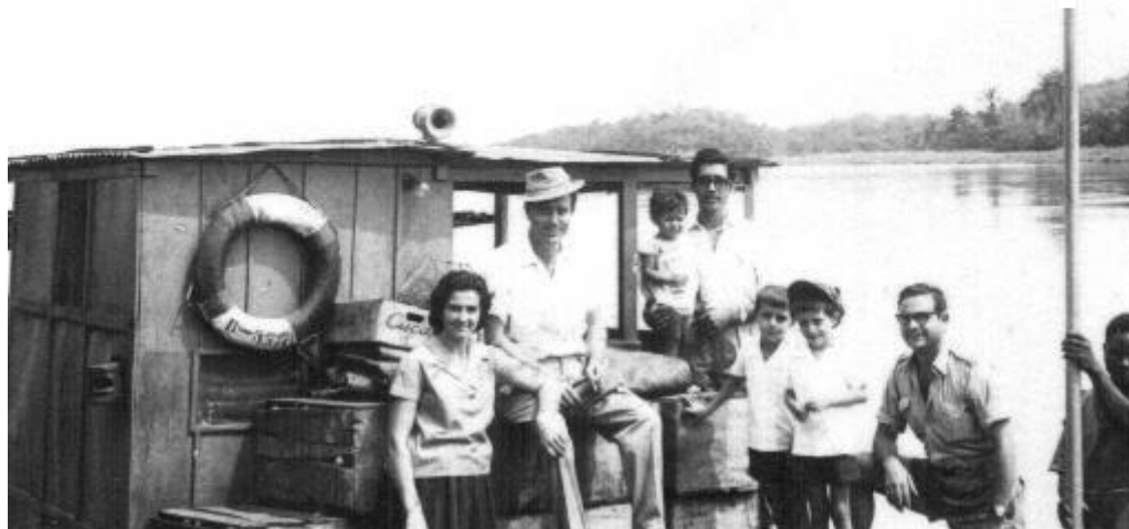
“Paquete Mucumbi” no cais da Muxima

Os quatro homens tomaram o pequeno-almoço, pagaram e saíram. Iam seguir viagem pela Quissama e perto do Cabo Ledo atravessariam o rio em direcção a Luanda num batelão destinado a essas travessias.