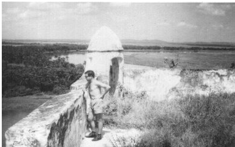
Na Fortaleza da Muxima. A guarita mais parece um símbolo fálico.

E o tempo aqui continuava a seguir lento. Nada de anormal. Uma volta pela povoação, que não demorava muito. Uma ida até à fortaleza, e isso já era um caso mais sério. A fortaleza ficava numa elevação muito íngreme, era necessário andar à volta, por caminhos de pedra, até chegar lá acima. Mas valia a pena. Conversava-se um pouco com a malta das transmissões, dava-se uma volta pela fortaleza que, tendo sido muito importante na época da colonização, pois servia de defesa ao rio e para montante da Muxima, não havia inimigo ou caravela que conseguisse passar. Agora eram só paredes no ar, com excepção de algumas guaritas que serviriam de abrigo ao pessoal que estivesse de serviço.