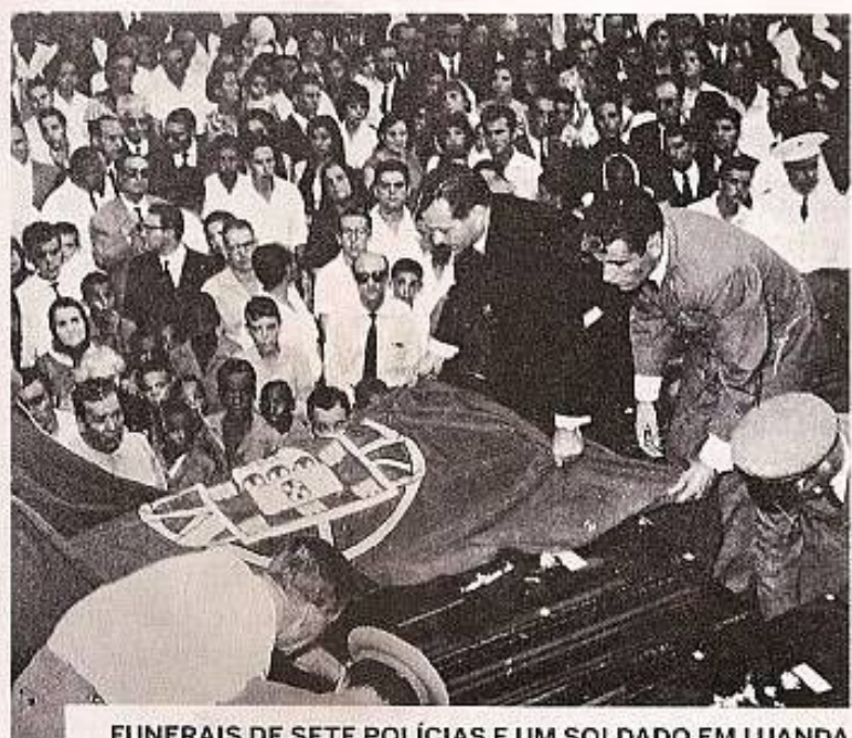
FUNERAIS DE SETE POLÍCIAS E UM SOLDADO EM LUANDA