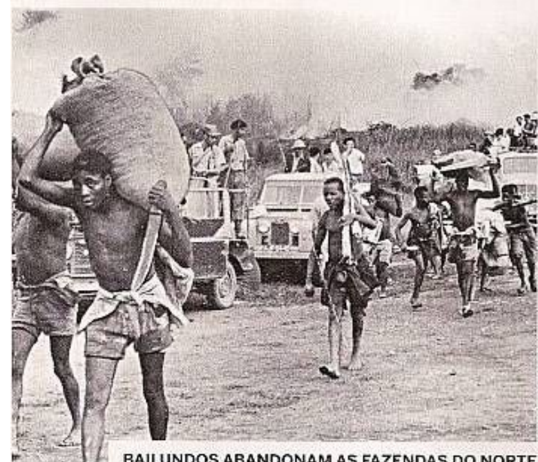
BAILUNDOS ABANDONAM AS FAZENDAS DO NORTE