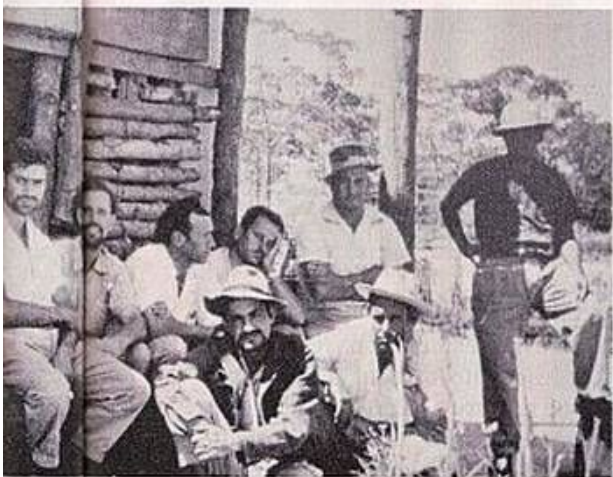
HABITANTES DE CANGOLA QUE RESISTIRAM AOS ATAQUES