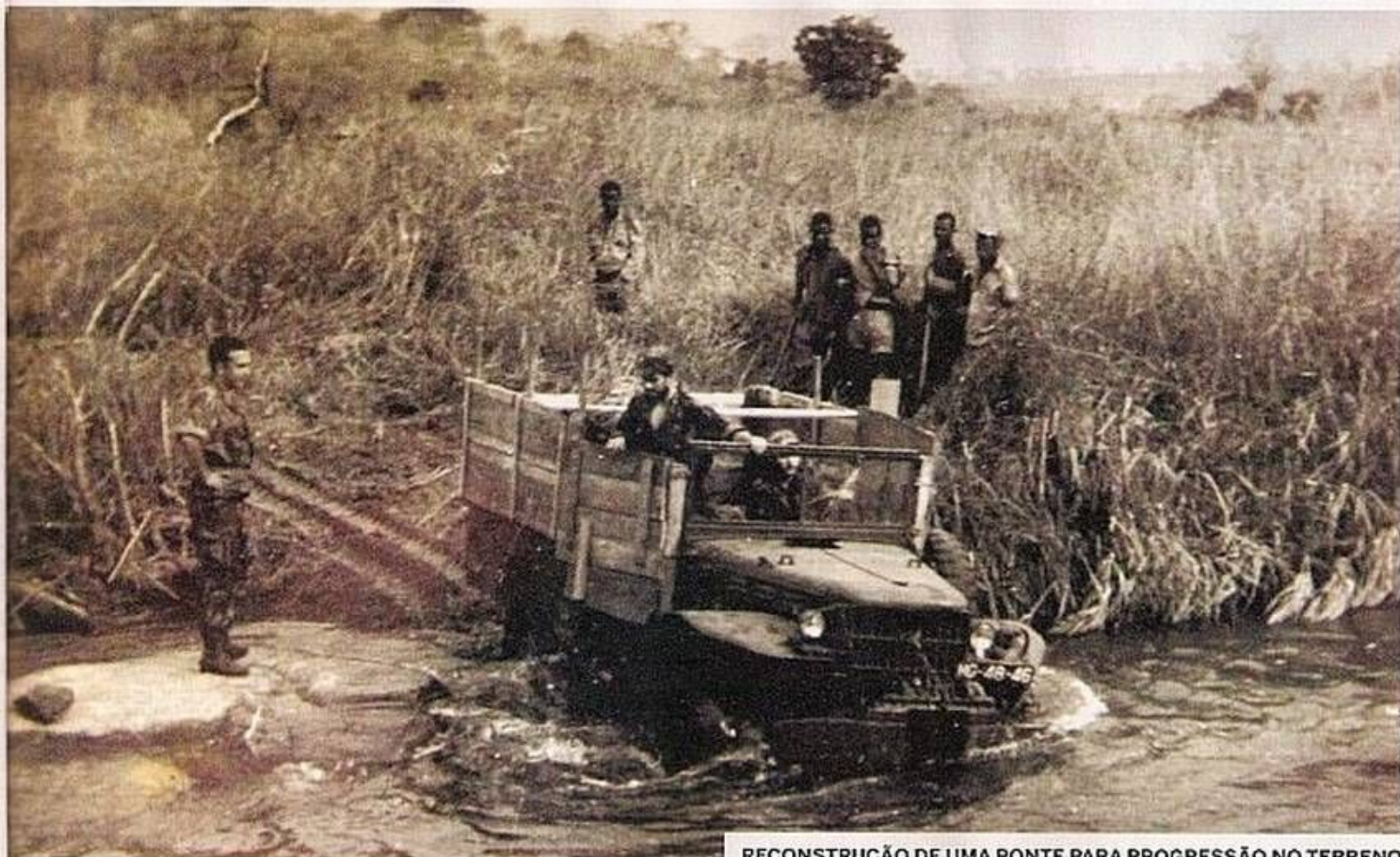
RECONSTRUÇÃO DE UMA PONTE PARA PROGRESSÃO NO TERRENO

Início da operação militar da União Indiana que leva à ocupação de Goa, Damão e Diu e desencadeia a Operação Vijay.