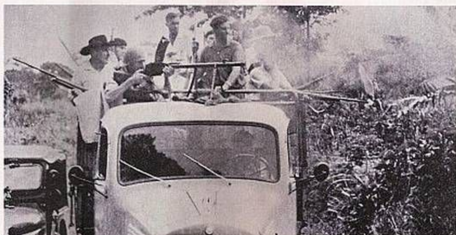
CIVIS COLABORAM COM O EXÉRCITO NA 'CAÇA AO HOMEM'