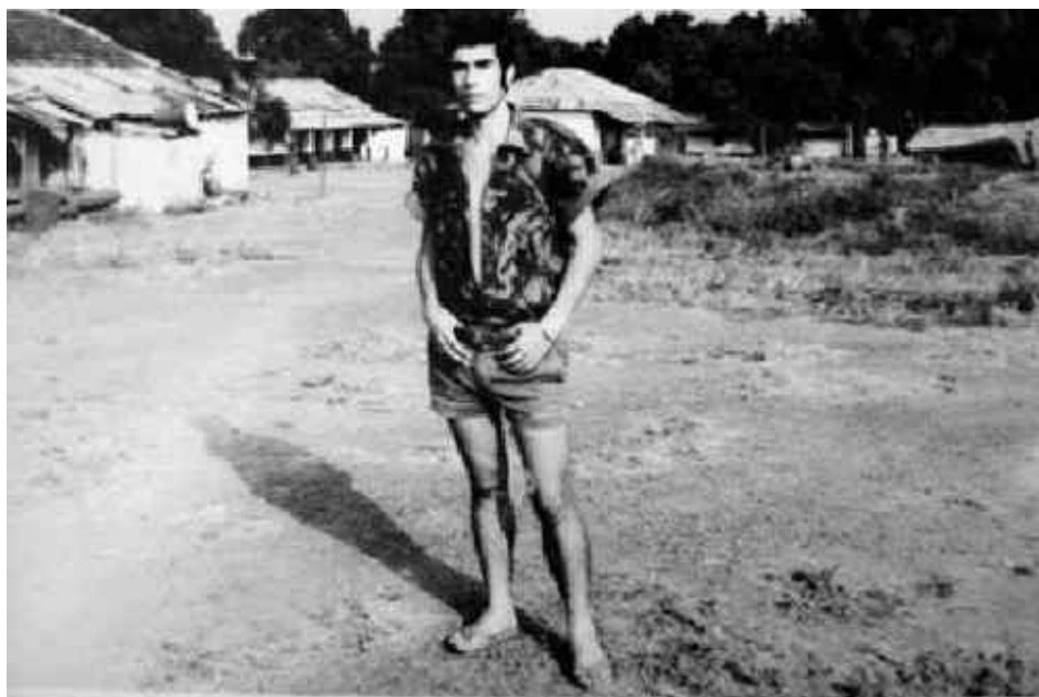
Panorâmica do XIME – 1972

No actual período, bem como nos demais, o adversário opta pela confrontação indirecta com as nossas tropas (minas e flagelações), revelando por tal razão algum receio em fazer-lhes frente directamente.