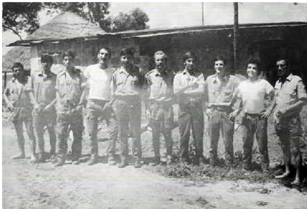
Pessoal das TRMS CART 3494 - XIME 1972

- No dia 17 durante 05 minutos o Aquartelamento do XIME volta a ser flagelado sem resultados.