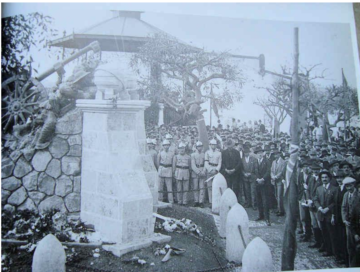
Inauguração do Monumento aos Mortos da Grande Guerra do Concelho de Loures

No dia 8 de Dezembro de 1929, Domingo e Feriado Nacional – Festa de Nossa Senhora da Conceição e Padroeira de Portugal desde 1640 - a população do concelho de Loures, manhã cedo, começa a dirigir-se à Praça da Liberdade onde, em tempos existiu o Palácio do Marquês da Fronteira, conhecido por Casaréus e destruído por um incêndio e onde, em 1916, foi erigido o actual edifício da Câmara Municipal.