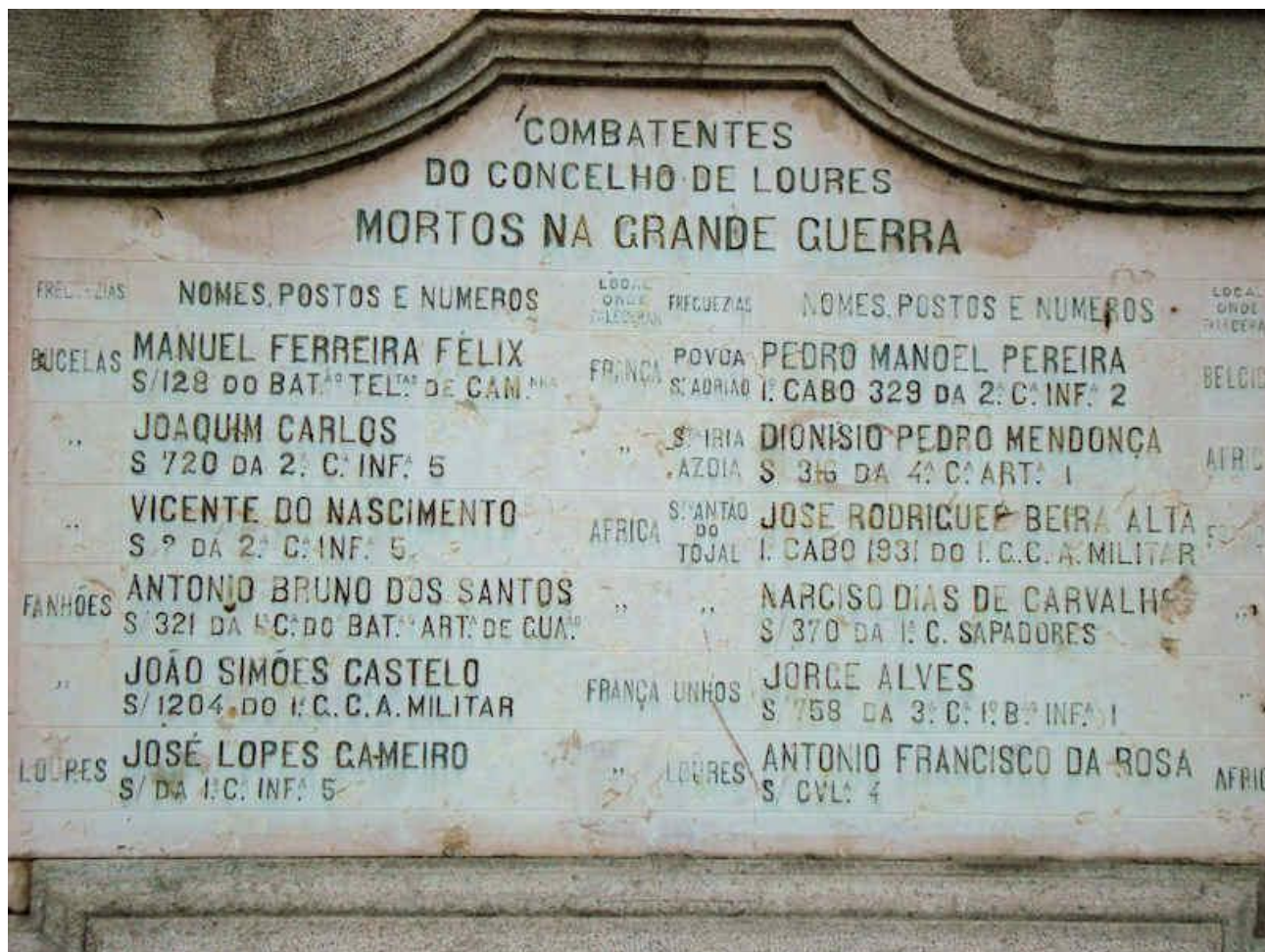
Nomes dos Combatentes caídos na Grande Guerra do Concelho de Loures