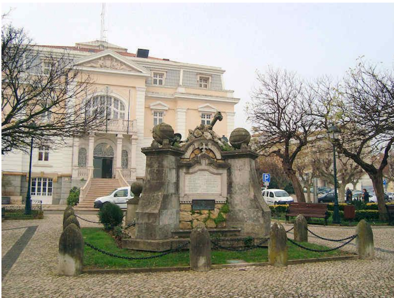
O Monumento frente aos Paços do Concelho.

A Comissão dos Padrões da Grande Guerra nasceu, em 3 de Dezembro de 1921, numa reunião levada a efeito na Sala Nobre da Escola do Exército estando presentes alguns combatentes sob a presidência do General Manuel de Oliveira Gomes da Costa, comissão que, durante quinze anos, procederia ao levantamento dos Padrões da Grande Guerra, não só no espaço metropolitano, mas também nas ilhas e colónias, além de vários monumentos no sector português, na Flandres. Promoveu as cerimónias de 9 de Abril e 11 de Novembro; organizou o museu de oferendas ao Soldado Desconhecido, no Mosteiro da Batalha; tomou parte na trasladação dos restos mortais do Soldado António Gonçalves Curado, do Regimento de Infantaria nº 28 (Figueira da Foz), tendo sido o primeiro militar português a cair no primeiro conflito mundial em 4 de Abril de 1917. Os seus restos mortais chegaram a Vila Nova da Barquinha, de onde é natural, ficando sepultado no monumento/sepultura que foi erigido na povoação, quando chegou em 31 de Julho de 1929. A Comissão foi extinta em 10 de Novembro de 1936.