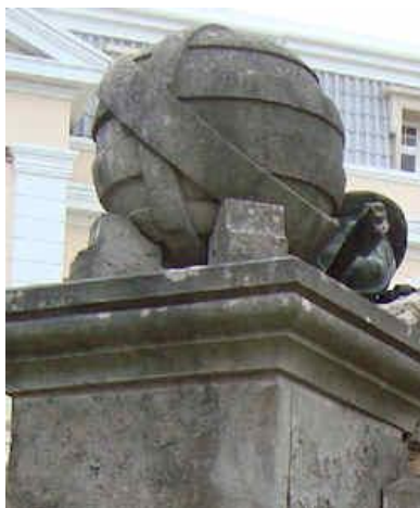
Esfera Armilar – Símbolo da Universalidade